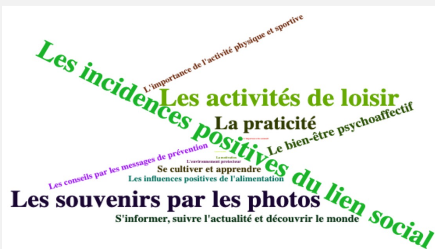
Figure 1 : Dénomination des 5 conséquences sanitaires favorables liées à l'usage des écrans les plus citées par les étudiants du SSES